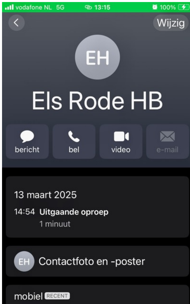
Poging tot bellen met Els Rode, donderdag 13 maart 2025 om 14u54

- Aangezien jij niet met mij spreekt of wilt spreken zie ik jouw email van hieronder als iets anders: als een instructie aan [naam] en [naam].